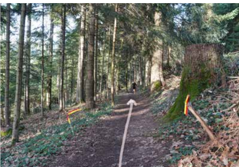
Weiter auf einem flachen Pfad, leicht abwärts ca. 500m