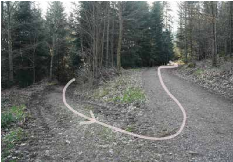
danach ca. 300m auf breitem Weg abwärts