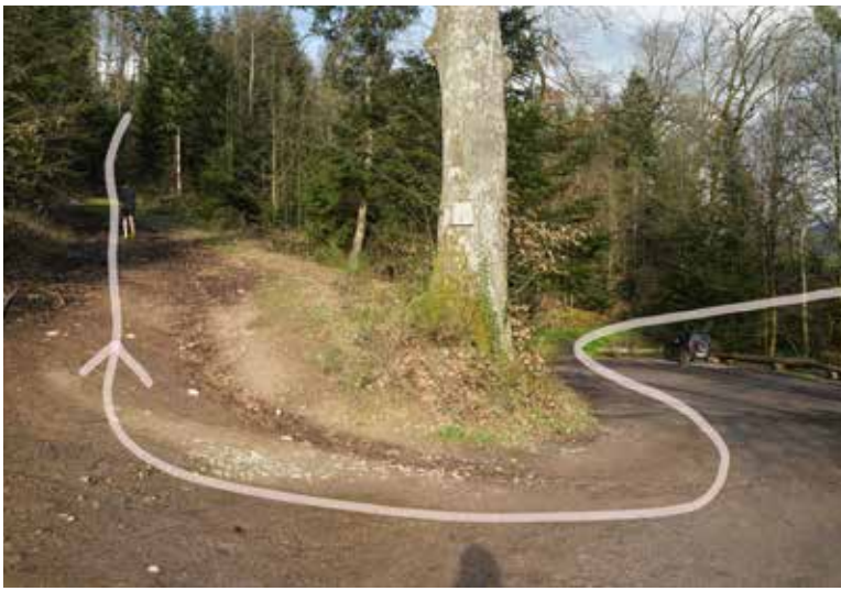
0,5-1 km steilerer Aufstieg breiter Waldweg