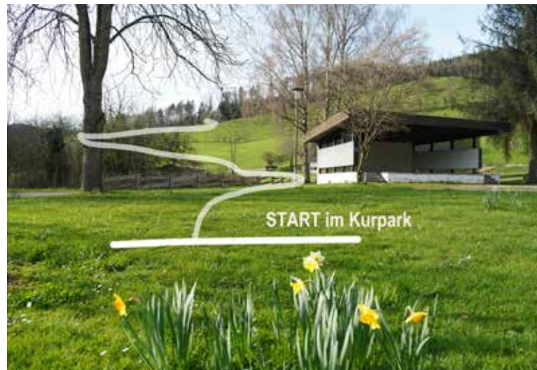
0-200m flach auf Teerstraße