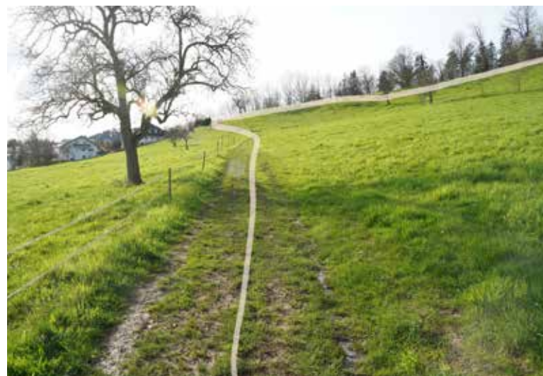
200-500m Wiesenweg ansteigend