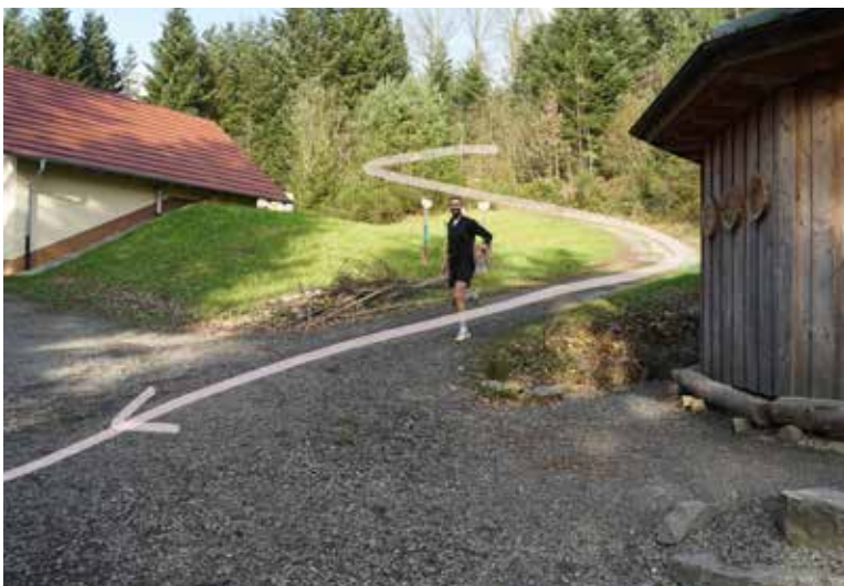
Weiter abwärts auf breitem Weg am Waldkindergarten vorbei